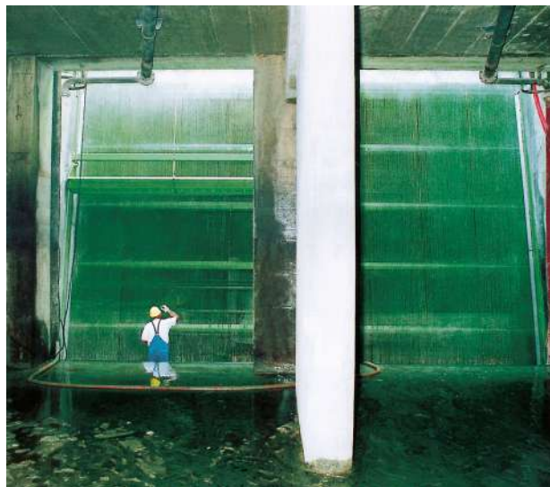
Passavant® Schalengreifer- rechen COB

Eine intelligente Abbauprogramm steuert die Förderung des Rechengutes aus jeder Position der Greiferschale. Sohlagerungen oder sperriges Treibgut werden schichtweise abgetragen. Bei Blockieren oder Überlast der Anlage wird durch eine spezielle mechanisch-elektrische Sicherheitssteuerung die Maschine abgeschaltet. Dieses Automatisierungssystem sorgt für eine außergewöhnlich hohe Betriebssicherheit und ermöglicht daher eine große Durchsatzleistung.