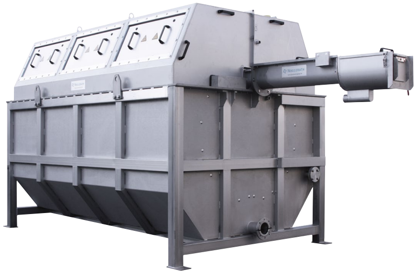
Trommelsieb Behältervariante, RSH-MG